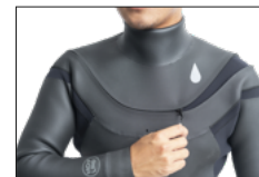
FIREFLY ZIP & WRAPP NECK