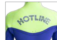
WATER DROP HOLL