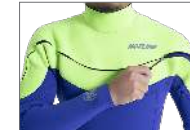
SCUTUM ZIP SYSTEM