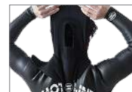
W-NECK OPTION +3.000