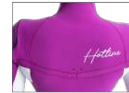
WATER DROP HOLL