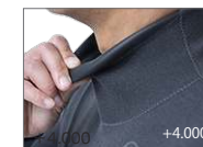
WRAPP NECK +4,000