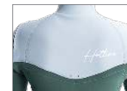
WATER DROP HOLL