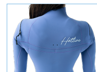
WATER DROP HOLL