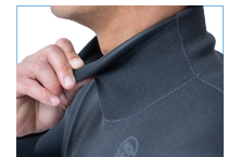
WRAPP NECK +4,400 円