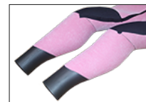
WATER BLOCK CUFF +2,000 (足首のみ対応) 内側をラバーにすることでより足首からの浸水を軽減