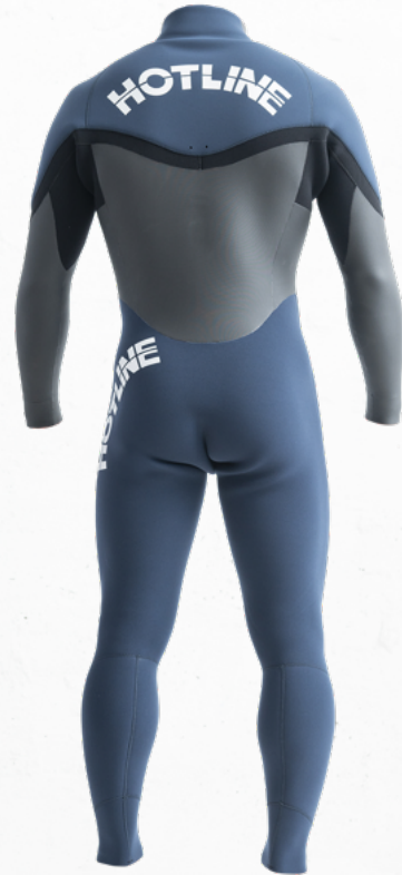
COLOR A: ラバー B: スレート C: スレート MARK 標元 10WT 左腰 1WT 背中 1WT 右袖 4WT