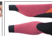
WRIST & ANKLE BACK J-CUFF