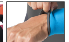
REPEL CUFF リペルカフ無料 指定の無い場合は切りっぱなし