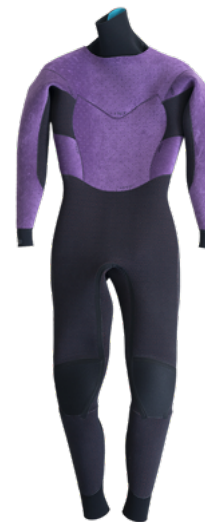
AFG(LEXIA COMB) INSIDE