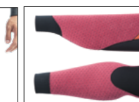
WRIST & ANKLE BACK J-CUFF