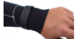
リストバンド付き

WARNING!! ご購入にあたり必ずお読み下さい (フリーズファイター&ムササビ共通)