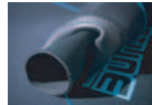
W カフ 5.000 円税抜き