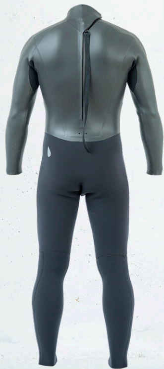
COLOR : A ラバー B.C.D ブラック MARK : 胸 10EMB ワッペン 左腰 10GY