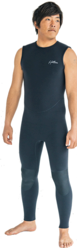
SMOOTHJAZZ LONG JOHN