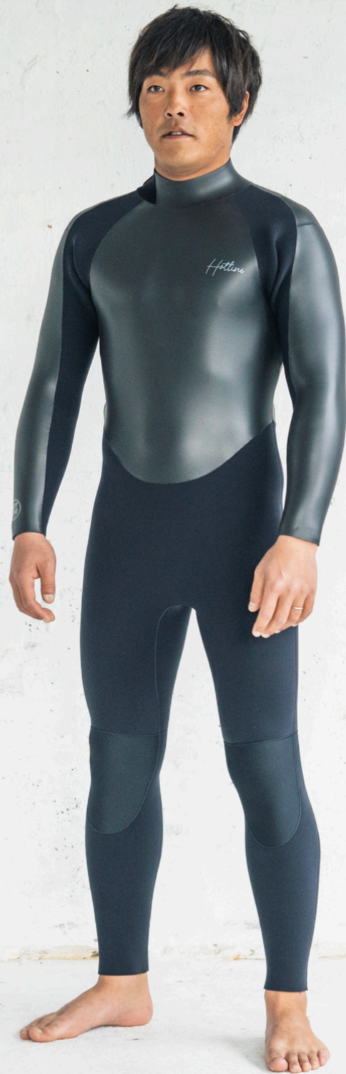
COLOR A : ラバー B.C.D: ブラック MARK 胸 8GY 背中 9GY 右袖 4GY