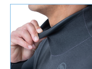
WRAPP NECK OPTION +4,400円