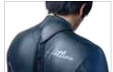
JAZZ TO FITHENECK