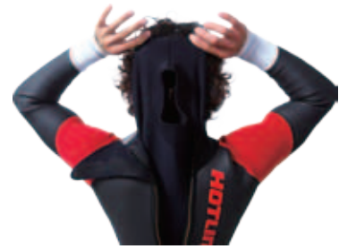
INNER W-NECK (標準)