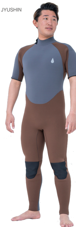
COLOR A:D: グレー B: マッド C: マッド D: D: グレー MARK 胸 10GY