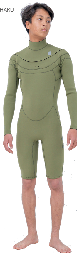
COLOR A:オリーブ B:オリーブ MARK 標元 10GY