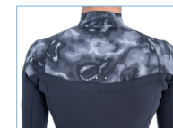
WATER DROP HOLL