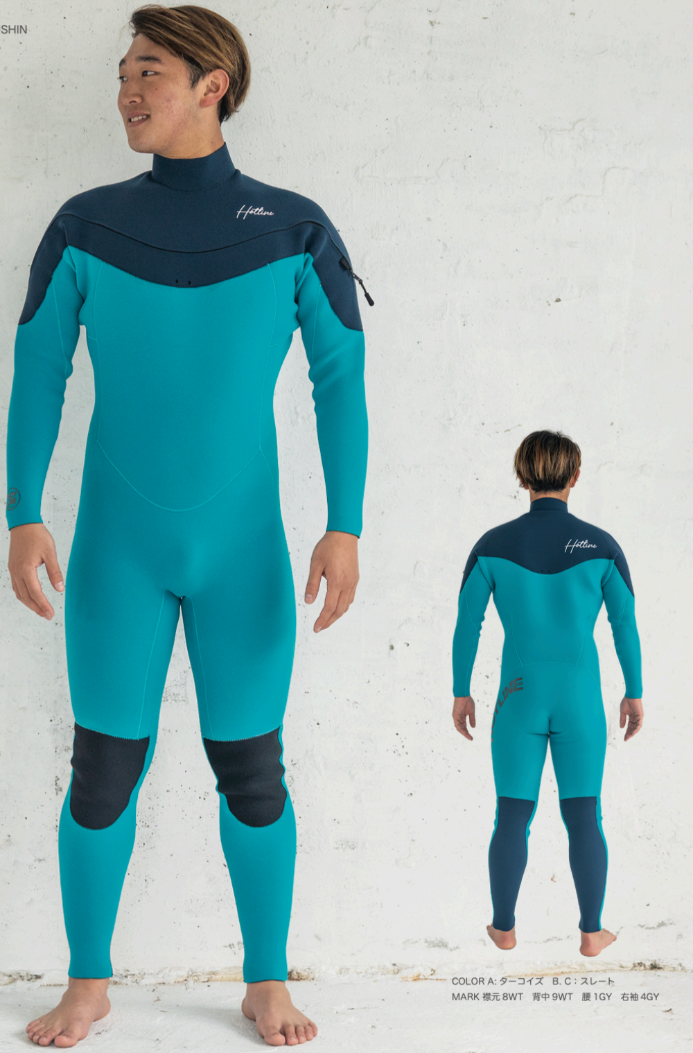
COLOR A: ターコイズ B, C: スレート MARK 襟元 8WT 背中 9WT 腰 1GY 右袖 4GY

ニュースタンダードになったロングチェストジップタイプのスキュータム。運動性能、防水性能を兼ね備えた人気のモデル