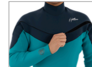
SCUTUM ZIP SYSTEM