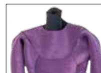
ENTRY PANEL LINING