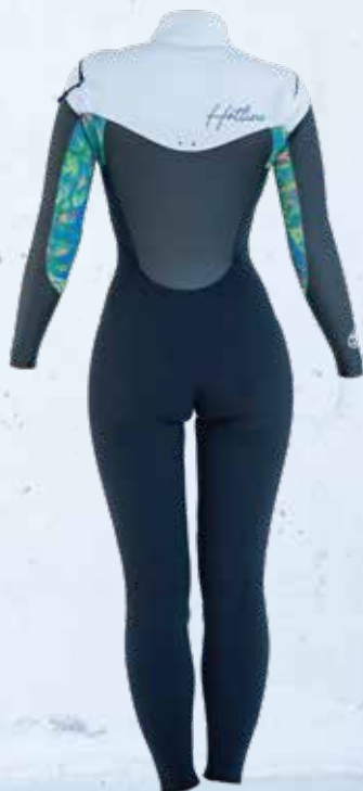
COLOR B: ホワイト C: パンパーカラー MARK 手首 4WT 襟元 8GY 背中 9GY