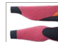
RIST & ANKLE WATER BLOCK CUFF