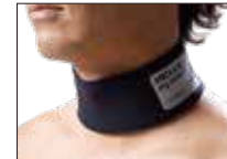
W-NECK RING 標準装備