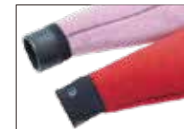
WATER BLOCK CUFF

指定のない場合は下の切りっぱなし。上はリベルオプション(無料) MUSASABI はリベル巻き不可