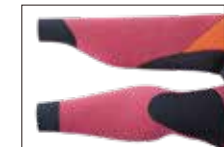
RIST & ANKLE WATER BLOCK CUFF