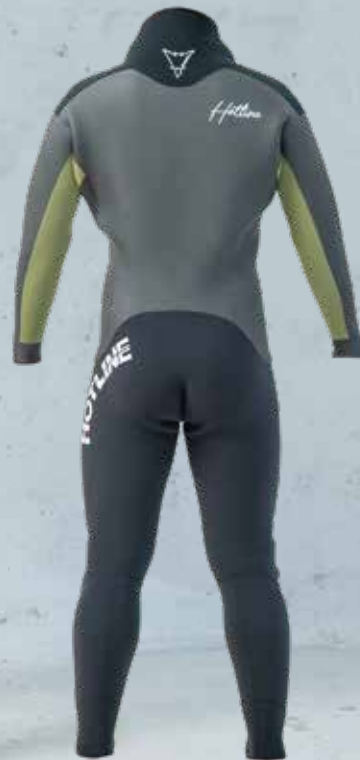
COLOR B オリーブ