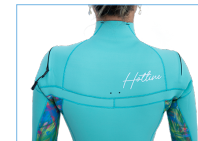
WATER DROP HOLL