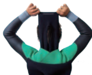
INNER W-NECK (標準)