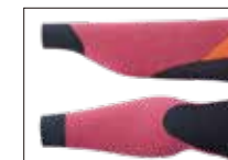
WRIST & ANKLE WATER BLOCK CUFF