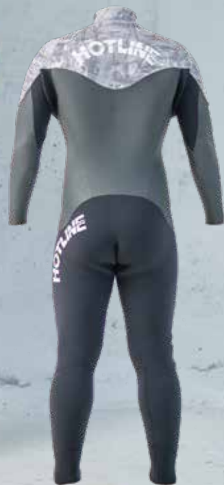
COLOR B: パンプーモノクロ MARK 襟元 8WT 背中 1WT 左腰 1WT