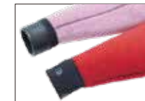
WATER BLOCK CUFF