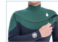
SCUTUM ZIP SYSTEM