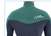
WATER DROP HOLL