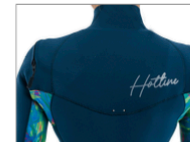
WATER DROP HOLL