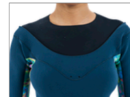
AMALFI ZIP ENTRY